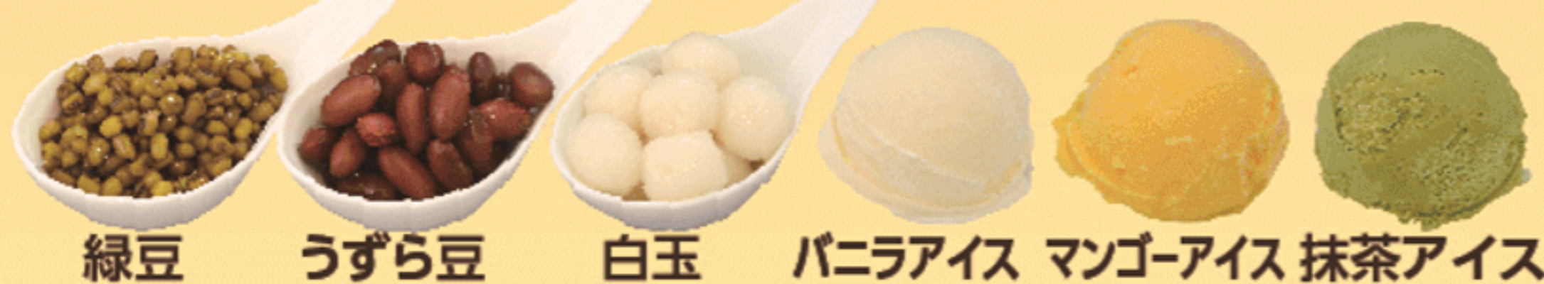
緑豆 うずら豆 白玉 パニラアイス マンゴーアイス 抹茶アイス