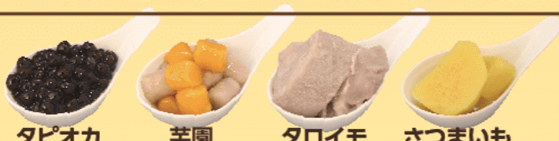
タピオカ 芋園 タロイモ さつまいも