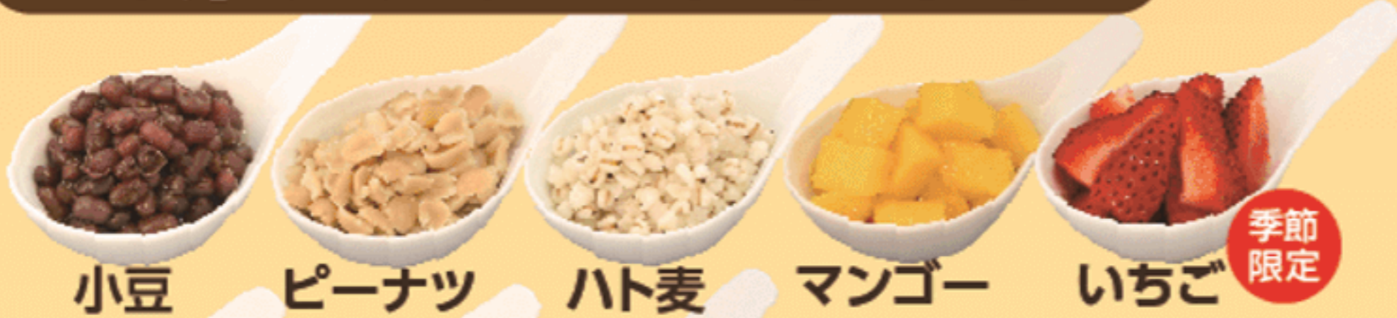
小豆 ピーナツ ハト麦 マンゴー いちご 季節限定